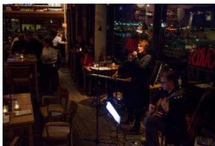
Und bei Monday meets Music im Carlsa