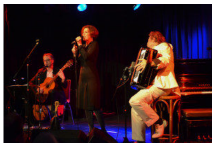
Stella & Ma Piroshka im Goldbekhaus

Anja Frauböse / Hauptartikel, Kunst und Kultur / 0 Comment