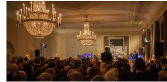
Blankeneser Neujahrsempfang 30 photos